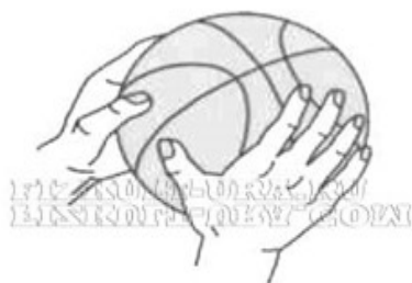
Бросок двумя руками от груди