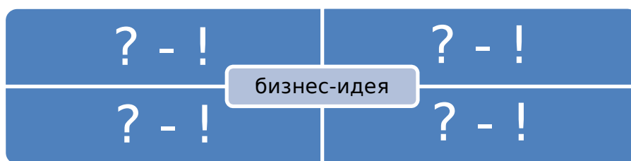
Рис № 1. На что необходимо опираться, чтобы найти для себя подходящую бизнес - идею.